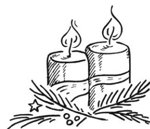
2. Advent: Die Erwartung wecken